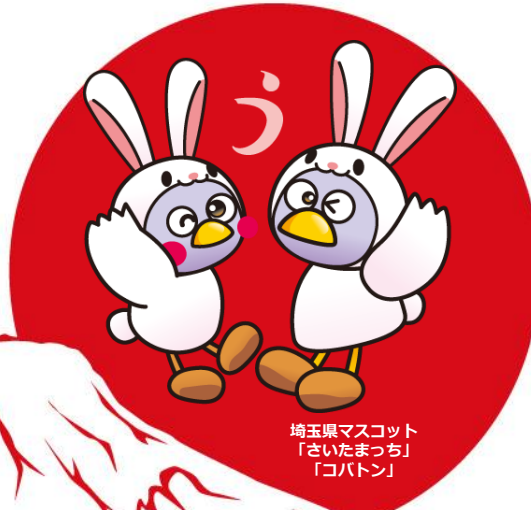
埼玉県マスコット 「さいたまっち」 「コバトン」